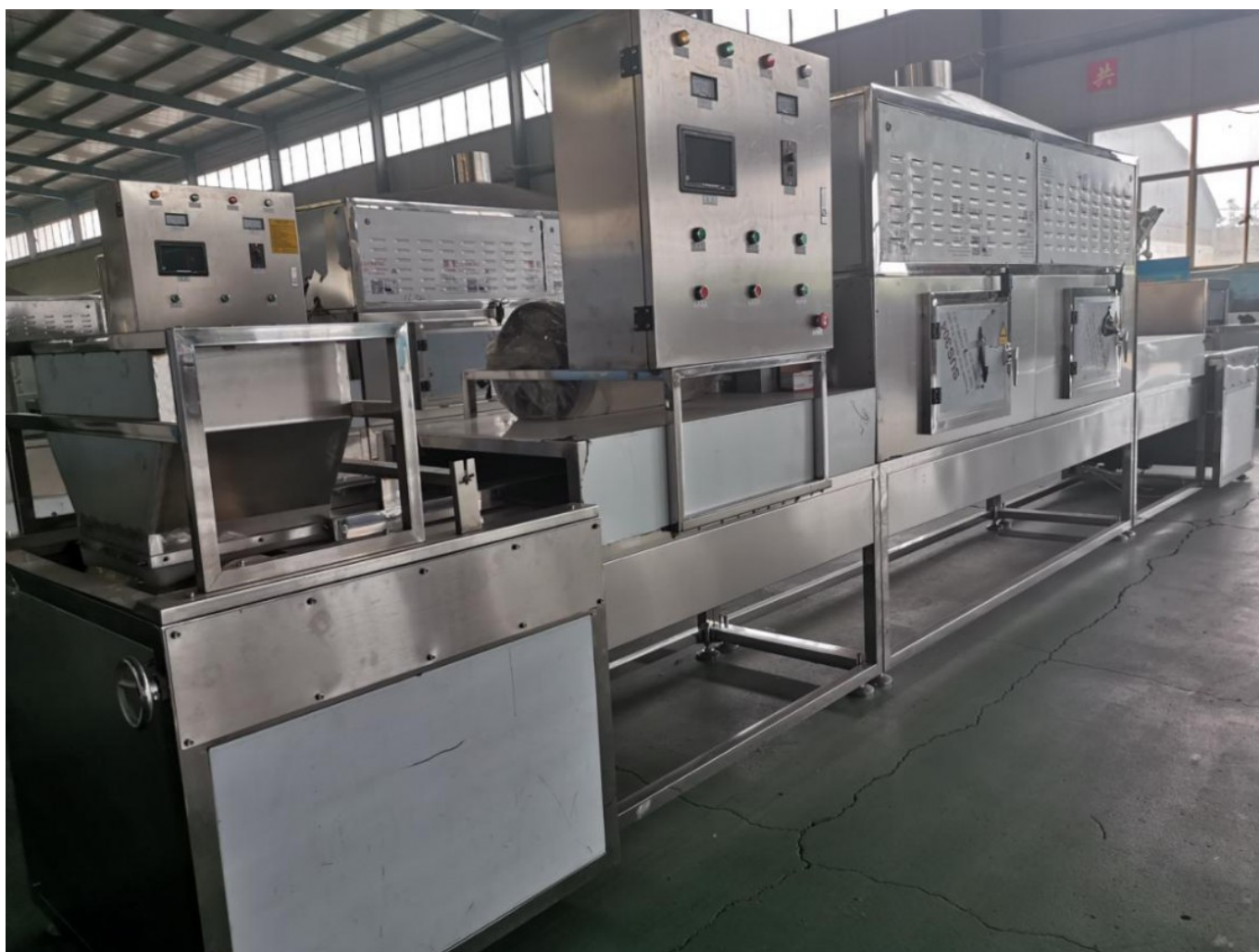
Equipo de secado por microondas para el mango

Como se muestra en la foto, es el equipo de secado de mango por microondas de Leader Microwave Equipment Company. Su fábrica también produce otros equipos de microondas. Como el equipo de secado de hongos por microondas, el equipo de descongelación de camarones por microondas, el equipo de esterilización de vino tinto por microondas son productos calientes.